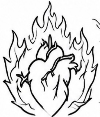
A HEART THAT DEVISES WICKED PLANS