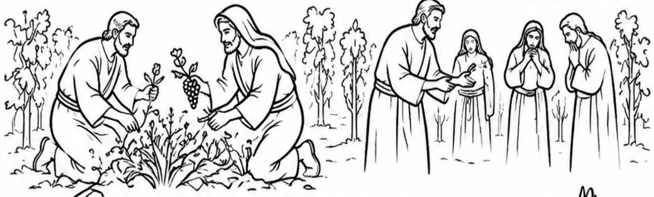
ONE WHO SOWS DISCORD AMONG BROTHERS