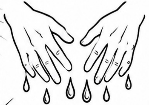
HANDS THAT SHED INNOCENT BLOOD