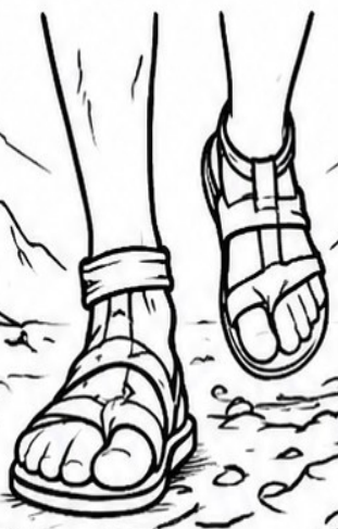
FEET THAT RUN TO EVIL