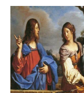
Jesus and the Samaritan Woman at the Well