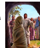
Jesus raises Lazarus from the dead.